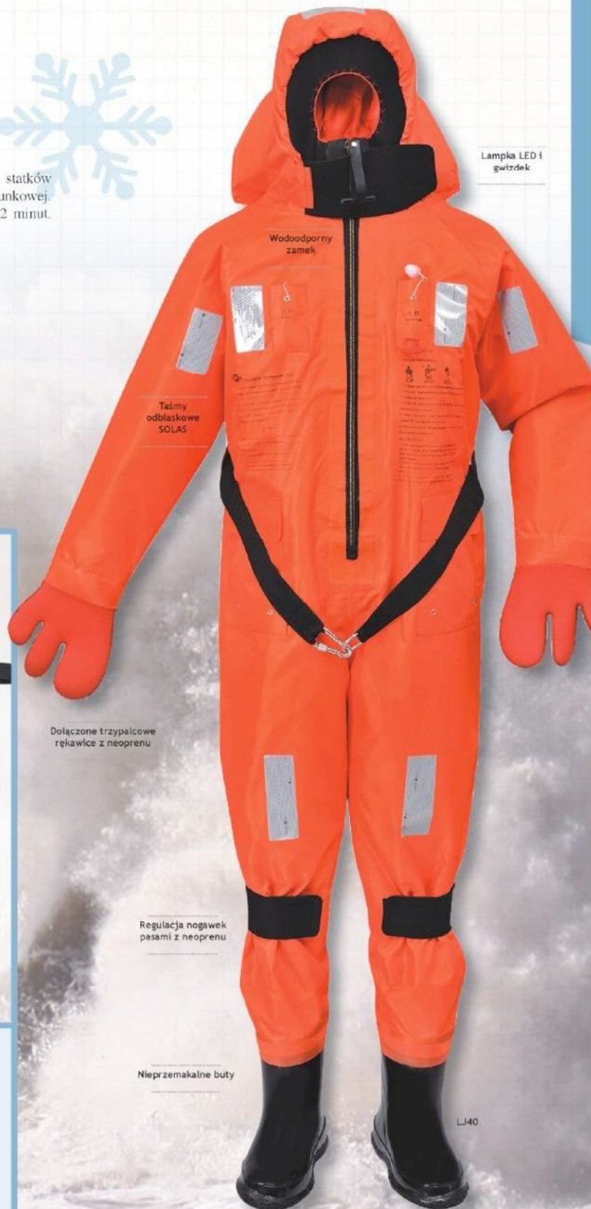
Lampka LED i gwizdek