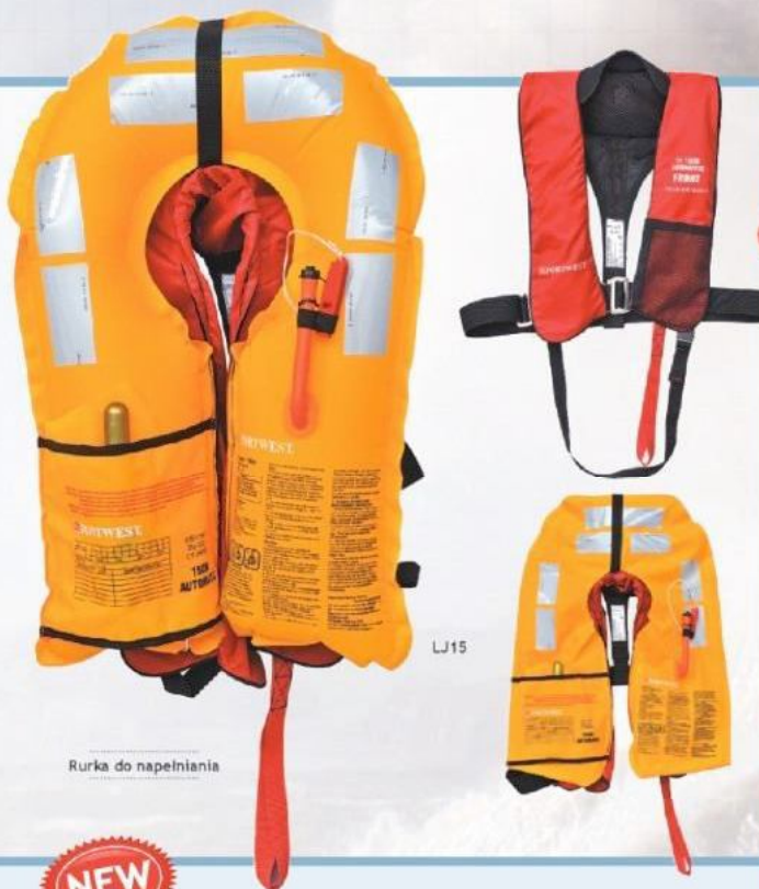
Rurka do napełniania